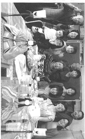
▲江別在住の外国人を招いて、祭りなど日本の文化を伝える