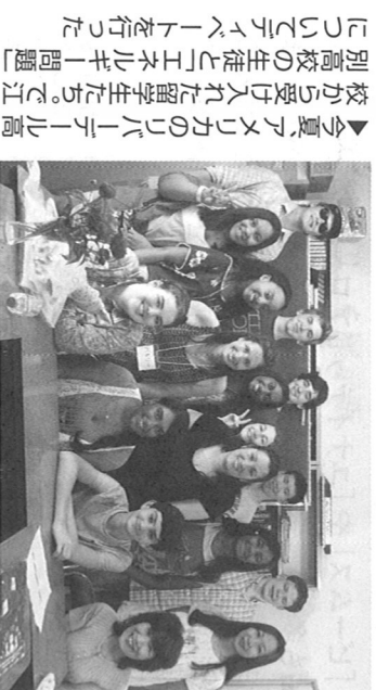
▲今夏アメリカのリバーデール高校から受け入れた留学生たち。江別高校の生徒とエクスチェンジプログラムを行いました

ネイティブスピーカーを講師に招く英会話サークルや、タイ人の先生が教えるヨガサークルなども開催。会員以外の参加も大歓迎です!